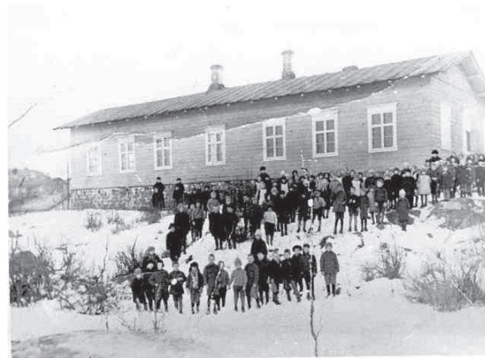
Den s.k. Gamla skolan på vars veranda Jänteväs första möte hölls.

en tynande tillvaro fram till år 1911 då den på initiativ av Jänteväs medlemmar återupptog sin verksamhet. År 1912 anslöt sig Jäntevä som underavdelning till svenska arbetarföreningen.