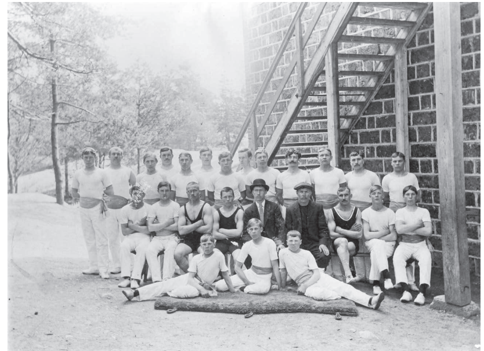
G. o. I. föreningen Jänteväs gymnaster och brottare utanför Folkskolan i Dalsbruk på 1910-talet.

Man tränade tre gånger per vecka; onsdags- och fredagskvällar samt söndagsförmiddagar. Träningarna pågick under hösten, vintern och våren. Uteblev gymnasterna från övningarna utan orsak var de tvungna att betala 25 penni i böter till föreningen. Ifall man uteblev från övningarna tre gånger å rad utan giltigt förhinder blev man utestängd från föreningen. Man tränade frihands-, stav-, räck-, och barrgymnastik samt pyramider på barr och golv. År 1909 uppträdde gymnasterna med ett gymnastikprogram vid två tillfällen. I februari ordnades en gymnastikförevisning i Hotellet i Dalsbruk och i mars en i Furulund i Kärra. Inkomsterna från förevisningarna användes i huvudsak till att köpa nya redskap.